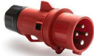
Ref. / Item 13300